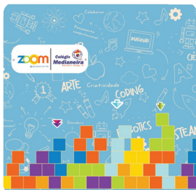
SALA DE EDUCAÇÃO TECNOLÓGICA