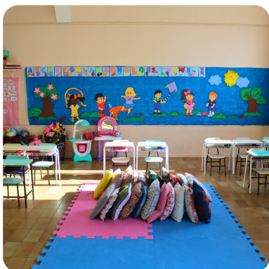
SALA EDUCAÇÃO INFANTIL