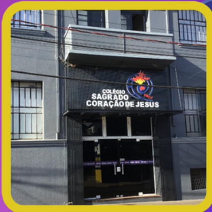
Colégio Sagrado coração de Jesus | SÃO BORJA