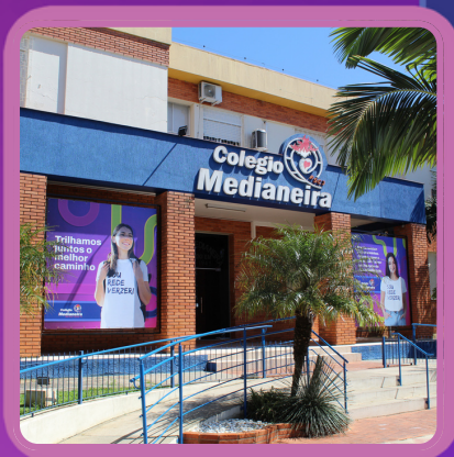
Colégio Medianeira | SANTIAGO