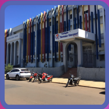
Colégio Tereza Verzeri | SANTO ÂNGELO