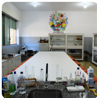
LABORATÓRIO DE CIÊNCIAS