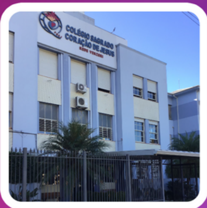
Colégio Sagrado coração de Jesus | IJUÍ