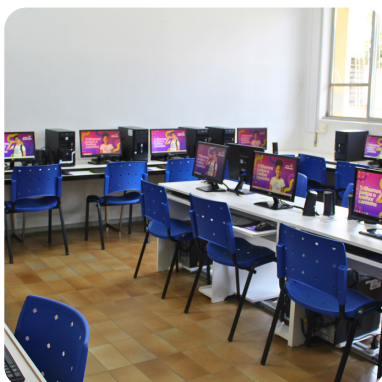
LABORATÓRIO DE INFORMÁTICA